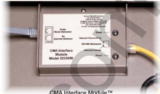
CMA Interface Module™